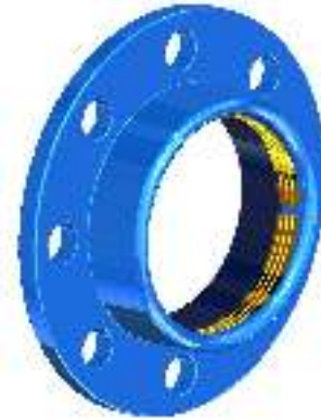
Эпоксидное покрытие RAL 5015, толщина 250 мкм

E-mail : sales@tecofi.fr - www.tecofi.fr